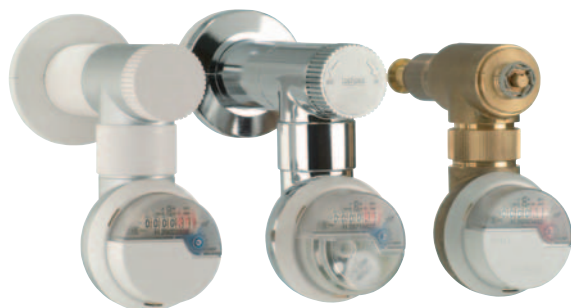
WZM za horizontalnu instalaciju